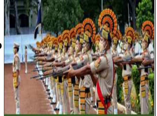
भारतीय पुलिस स्मृति दिवस 2024

Police Smriti Diwas, also known as Police Shaheed Diwas, is celebrated every year on 21 October. This day is dedicated to paying tribute to the brave policemen who sacrificed their lives to maintain the security and peace of the country. On this occasion, various programs are organized across the country, where martyred policemen are honored.