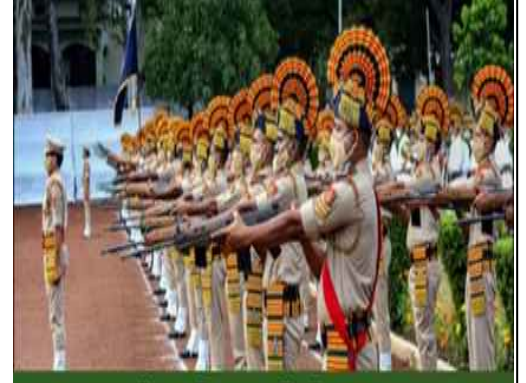
भारतीय पुलिस स्मृति दिवस 2024

पुलिस स्मृति दिवस, जिसे पुलिस शहीद दिवस भी कहा जाता है, हर साल 21 अक्टूबर को मनाया जाता है। यह दिन उन वीर पुलिसकर्मियों को श्रद्धांजलि देने के लिए समर्पित है जिन्होंने देश की सुरक्षा और शांति बनाए रखने के लिए अपने प्राणों की आहुति दी। इस अवसर पर देशभर में विभिन्न कार्यक्रम आयोजित किए जाते हैं, जहां वीरगति को प्राप्त पुलिसकर्मियों को सम्मानित किया जाता है। पुलिसकर्मी समाज के लिए एक महत्वपूर्ण स्तंभ होते हैं